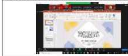
Foto 1. Dokumentasi Zoom Meeting