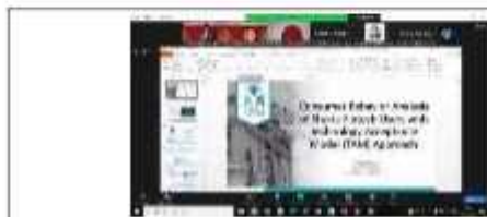
Foto 3. Dokumentasi Zoom Meeting