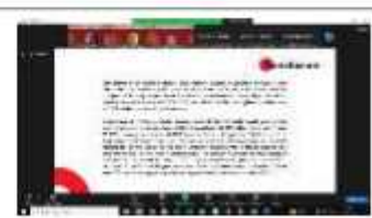
Foto 4. Dokumentasi Zoom Meeting

Dokumentasi lengkap bisa diperoleh di database panitia: